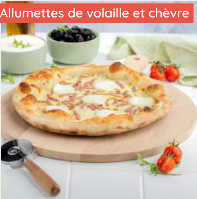
Garniture : Base crème fraîche, mozzarella, allumettes de volaille, chèvre, origan