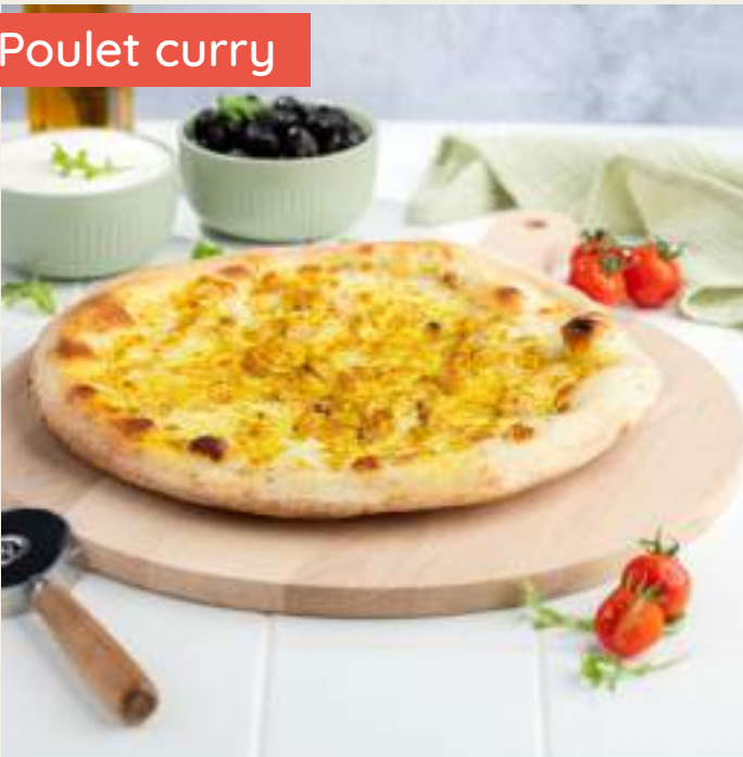
Garniture : Base crème fraîche, mozzarella, poulet, sauce curry, origan