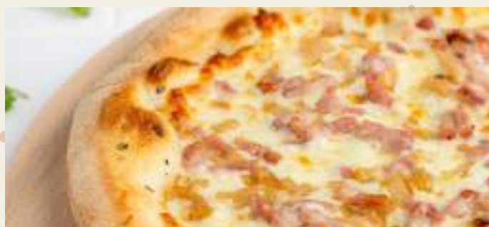
Jambon fromage tomate