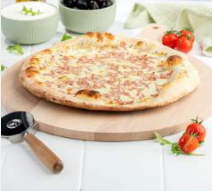
Garniture : Base crème fraîche, mozzarella, allumettes de jambon, origan