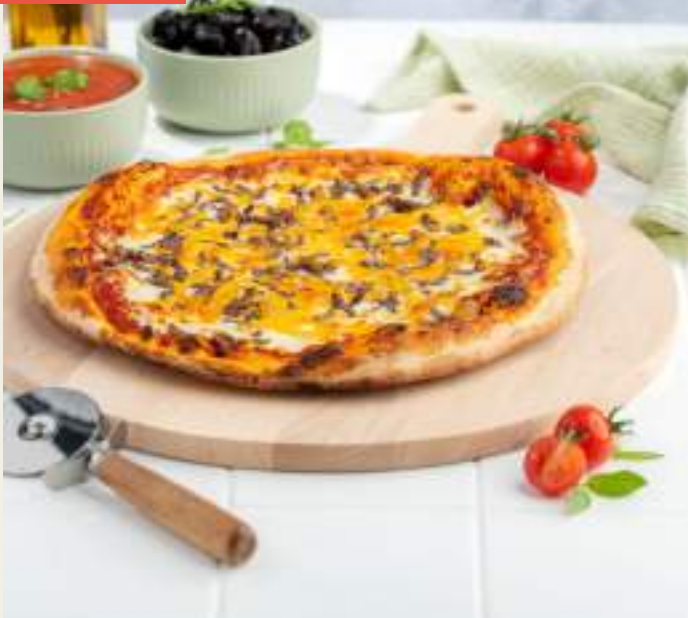
Garniture : Base sauce tomate provençale, mozzarella, viande hachée, cheddar, sauce burger, origan