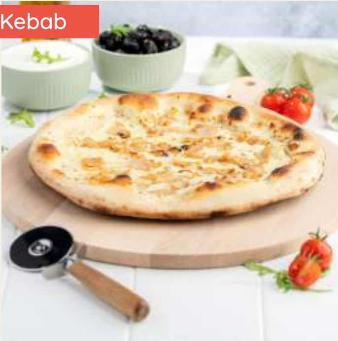
Garniture : Base crème fraîche, mozzarella, viande de kebab, sauce blanche, origan