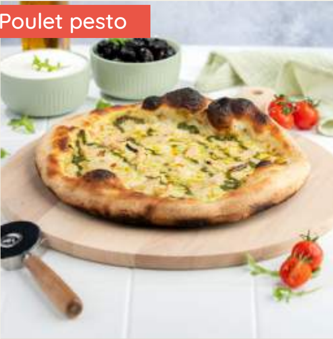
Garniture : Base crème fraîche, mozzarella, poulet, pesto, origan